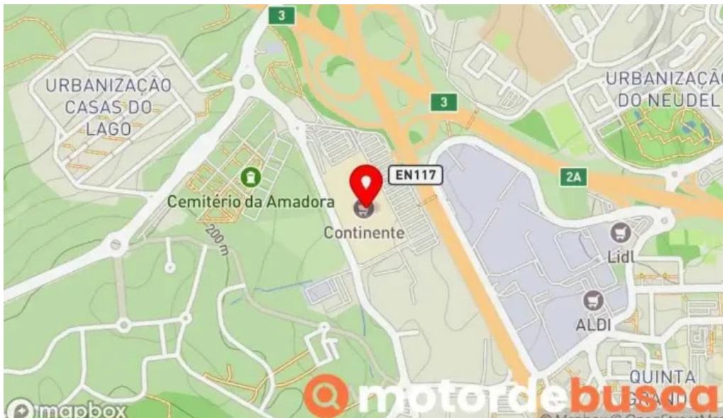
Continente amadora mapa