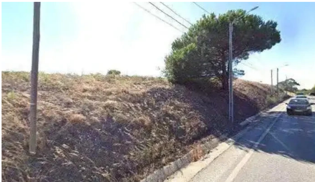
Continente amadora street view e 360deg