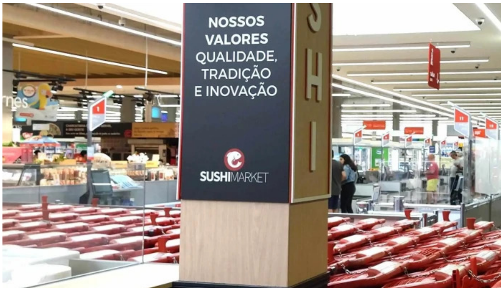
Continente amadora perto de mim