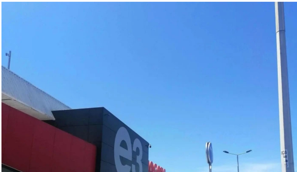
Continente amadora onde