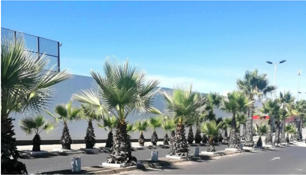
Continente amadora instagram