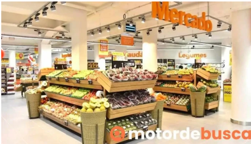
Continente amadora interior