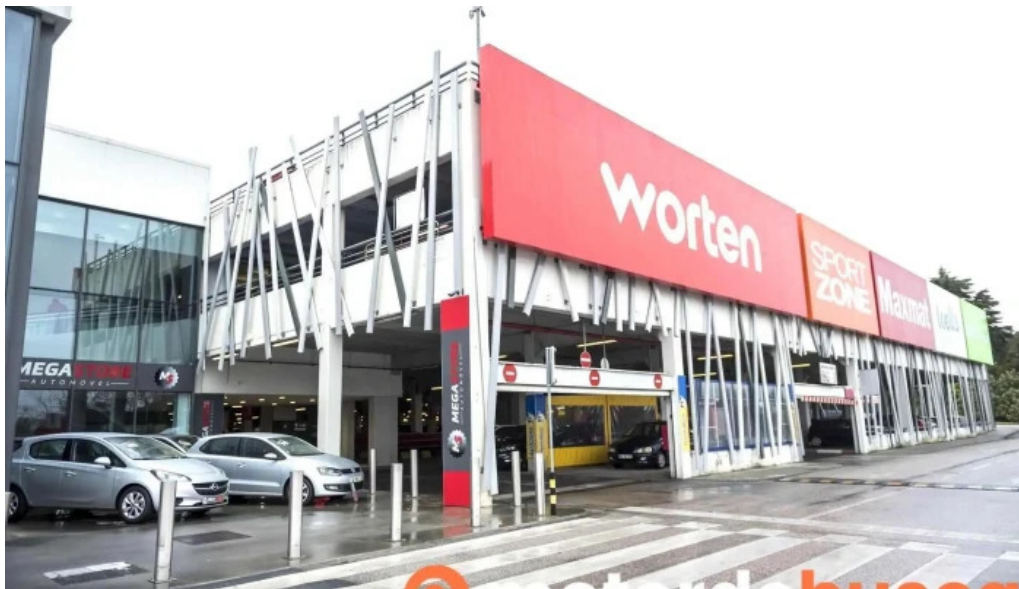
Continente amadora tudo