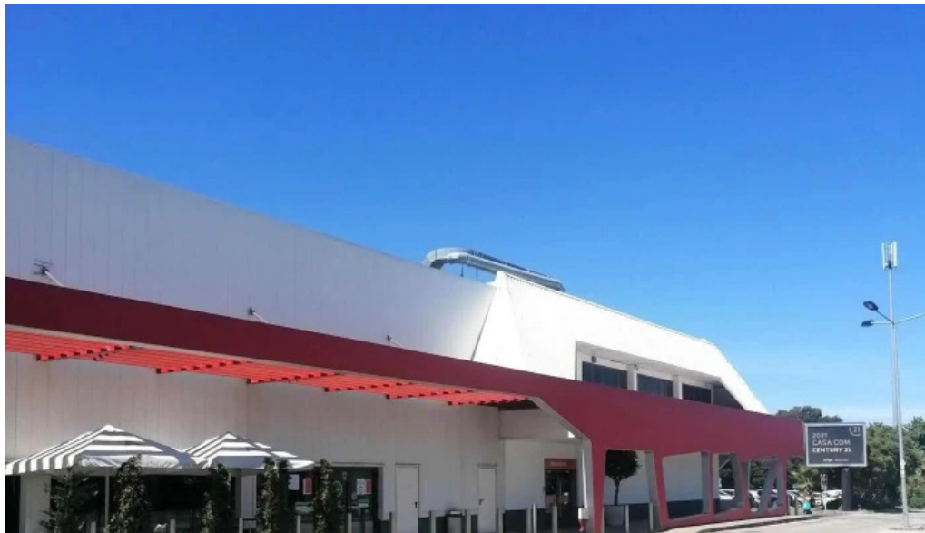
Continente amadora numero