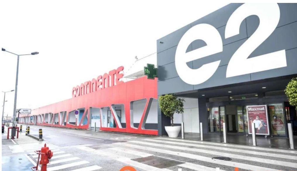
Continente amadora do proprietario