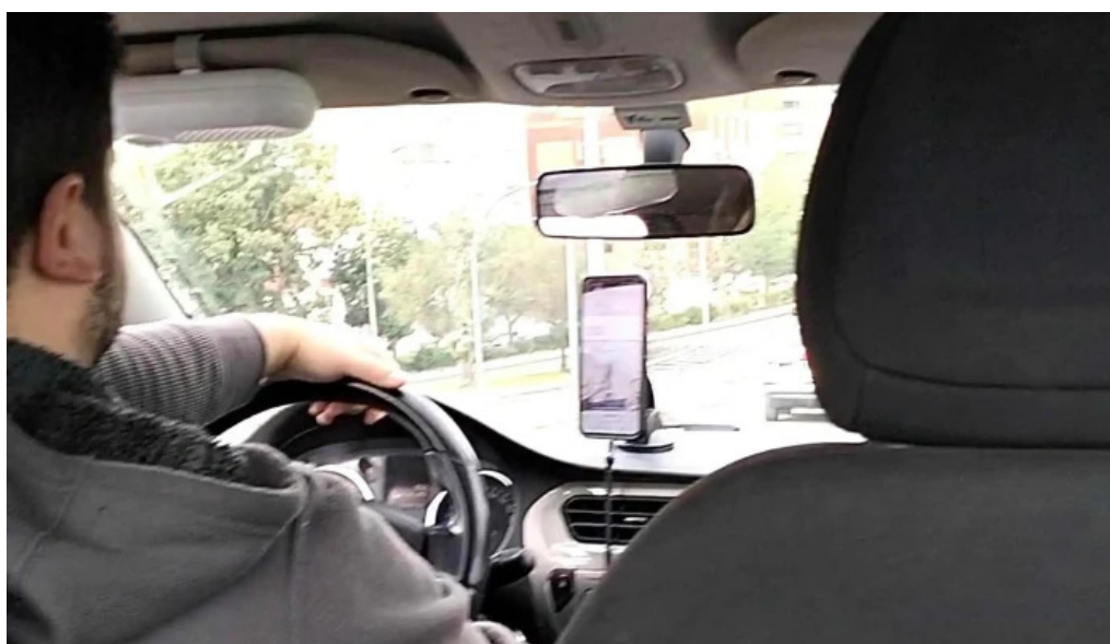
Continente amadora amadora