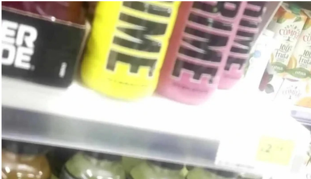
Continente amadora mais recentes