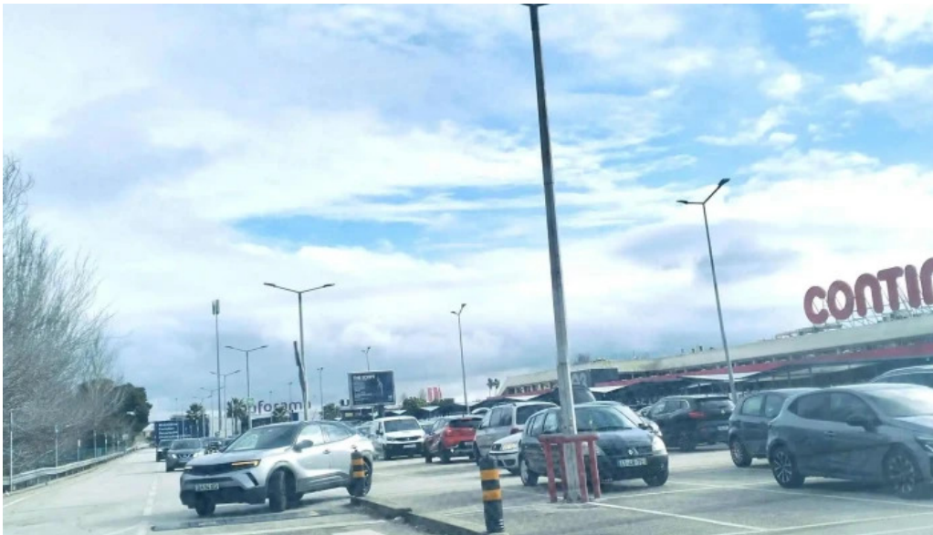
Continente amadora hipermercado