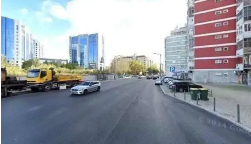
Farmacia j ribeiro street view e 360deg