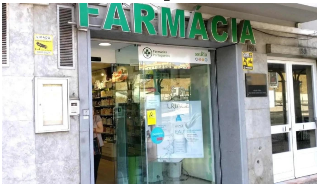
Farmacia j ribeiro tudo