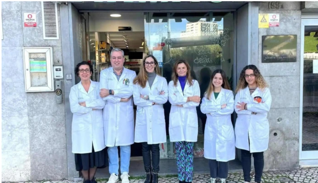
Farmacia j ribeiro do proprietario