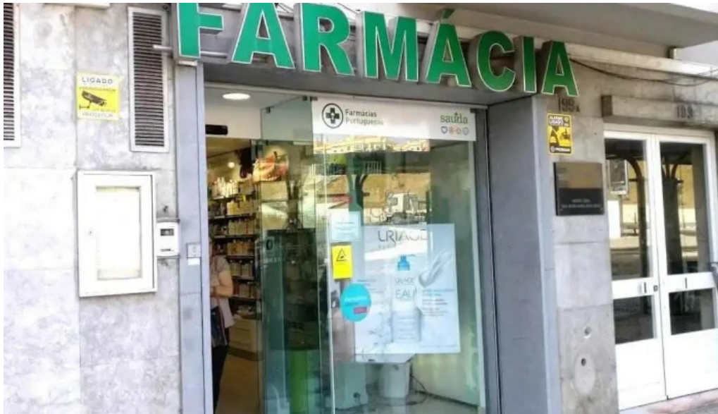
Farmacia j ribeiro lisboa