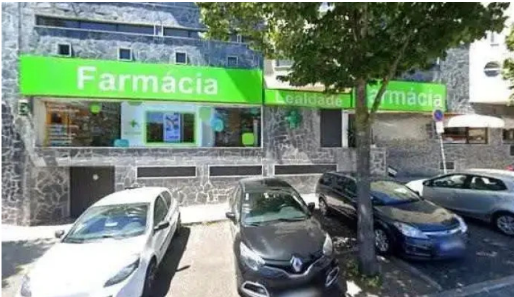
Farmacia lealdade street view e 360deg