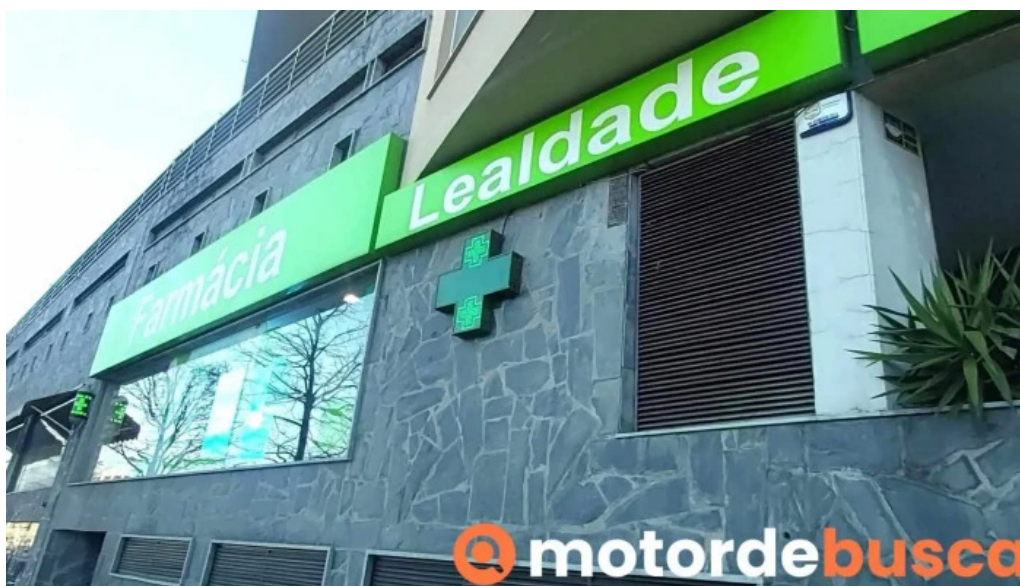
Farmacia lealdade linda a velha