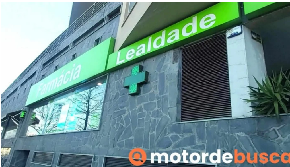
Farmacia lealdade tudo