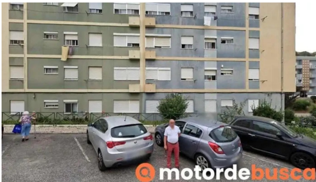
Farmacia mendonca apelacao