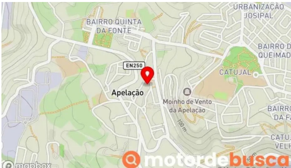
Farmacia mendonca mapa