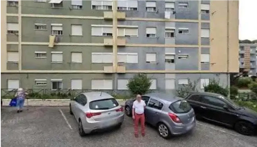
Farmacia mendonca tudo