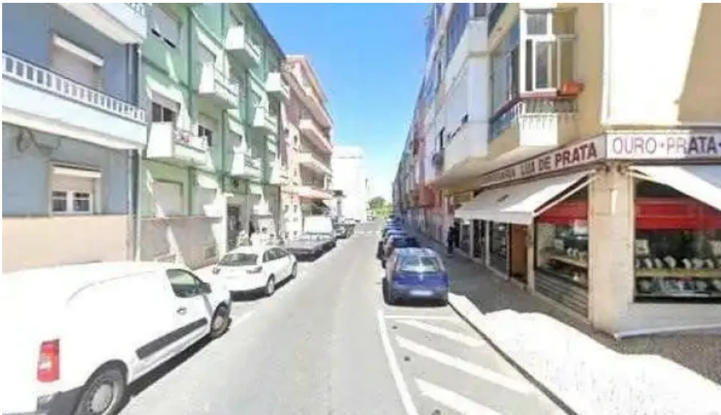
Isabel maria peixoto tudo