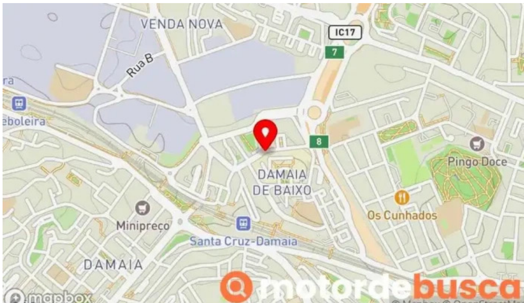
Isabel maria peixoto mapa