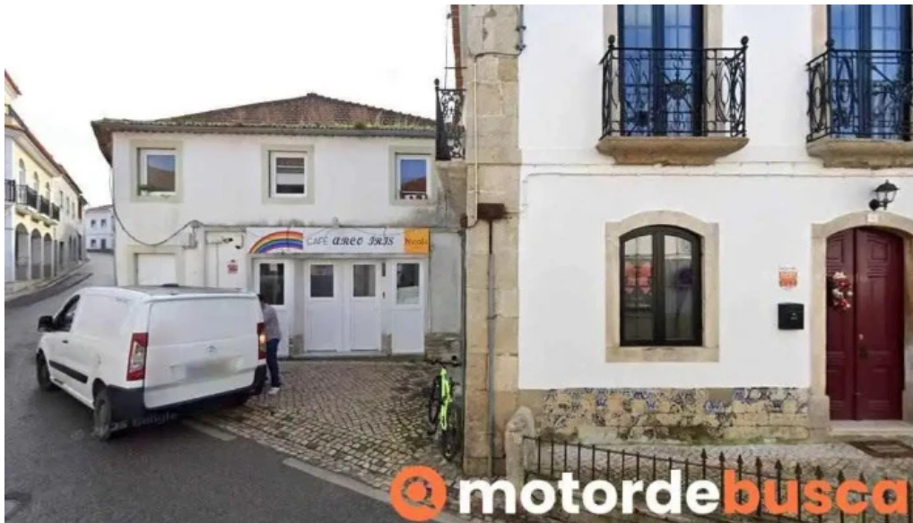
Dulce gaspar unipessoal Ida abrigada