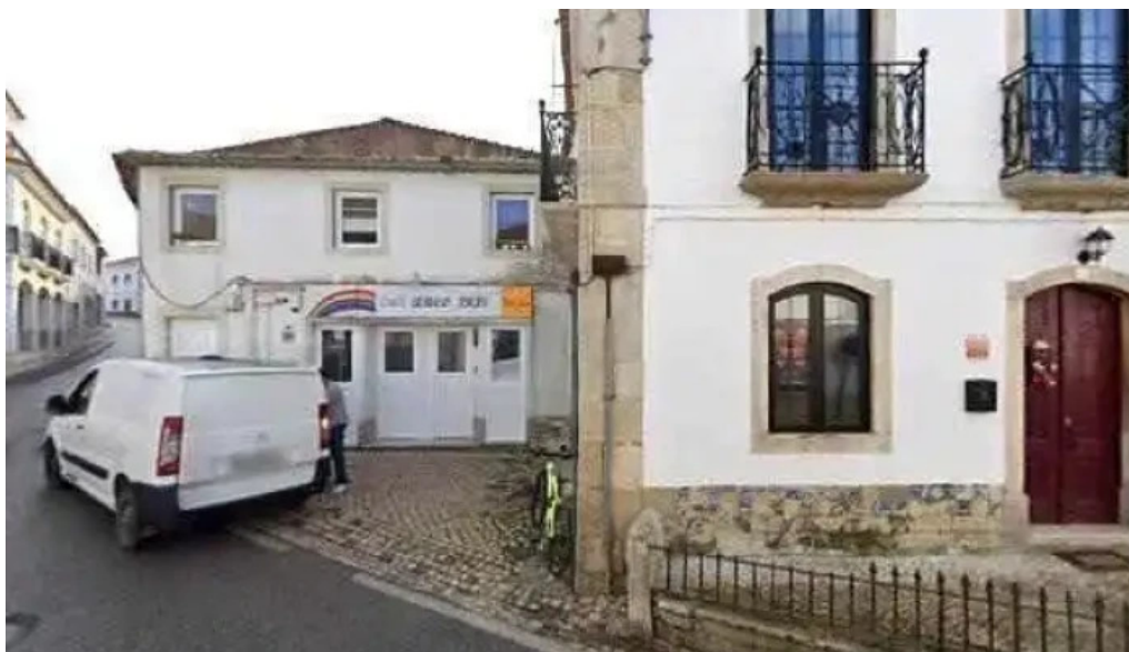
Dulce gaspar unipessoal Ida tudo